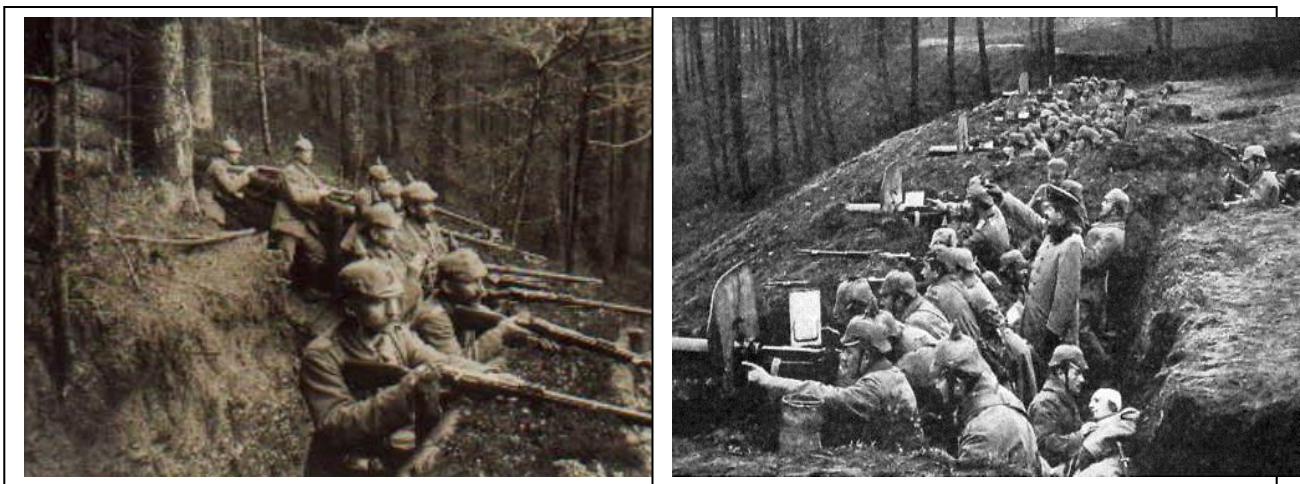
(Schützengräben im schrecklichen Stellungskrieg des Ersten Weltkrieges)

Doch das Grauen dieser Materialschlachten, die vor allem 1916 einsetzten, soll hier nur durch die öffentlich und allgemein bekannten Verlustziffern angedeutet werden: Durch Tod, Verwundung oder Gefangenschaft verloren die Deutschen bei Verdun 282.000, an der Somme 220.000 Mann, während die entsprechende Verluste bei Franzosen und Engländer 317 000 und 270 0000 betragen. Inmitten dieses kriegerischen Chaos, zwischen Angst, Tod und Grausamkeit, entstand der auf dieser Seite abgedruckte Front-Brief des als Soldat dienenden Lehrers an seine Schülerin Theresle.