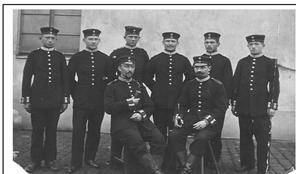
(Deutsche Rekruten 1914)

Die Kriegsbegeisterung der Deutschen während der ersten Kriegsjahre ab 1914 ist uns Zeitgenossen beileibe nicht mehr verständlich. Wie die vielfältigen Zeitdokumente und Geschichtsbücher aufzeigen, schlug diese Kriegsbegeisterung gerade zu Beginn 1914 nach dem Mordanschlag in Sarajevo besonders hohe Wellen: Jubelnde Freiwillige - und auch die damaligen politischen Parteien stimmten in den Jubel ein.