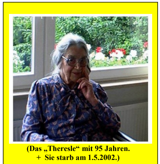
(Das „Theresle“ mit 95 Jahren. + Sie starb am 1.5.2002.)

Trotzdem aber spricht man auch heute erstaunlicherweise noch immer von der sogenannten „ guten alten Zeit “. ... - Diesen Ausspruch sollten wir als alte Mähr begraben und dafür die vielen – von freundschaftlichem Geist geprägten Partnerschaftsbeziehungen von heute herzlich und fröhlich pflegen, die in den letzten Jahrzehnten in dem uns längst selbstverständlichen, friedlichen Miteinander zwischen den Menschen unserer Gemeinden und denen der einstigen Gegnerländer entstanden sind.