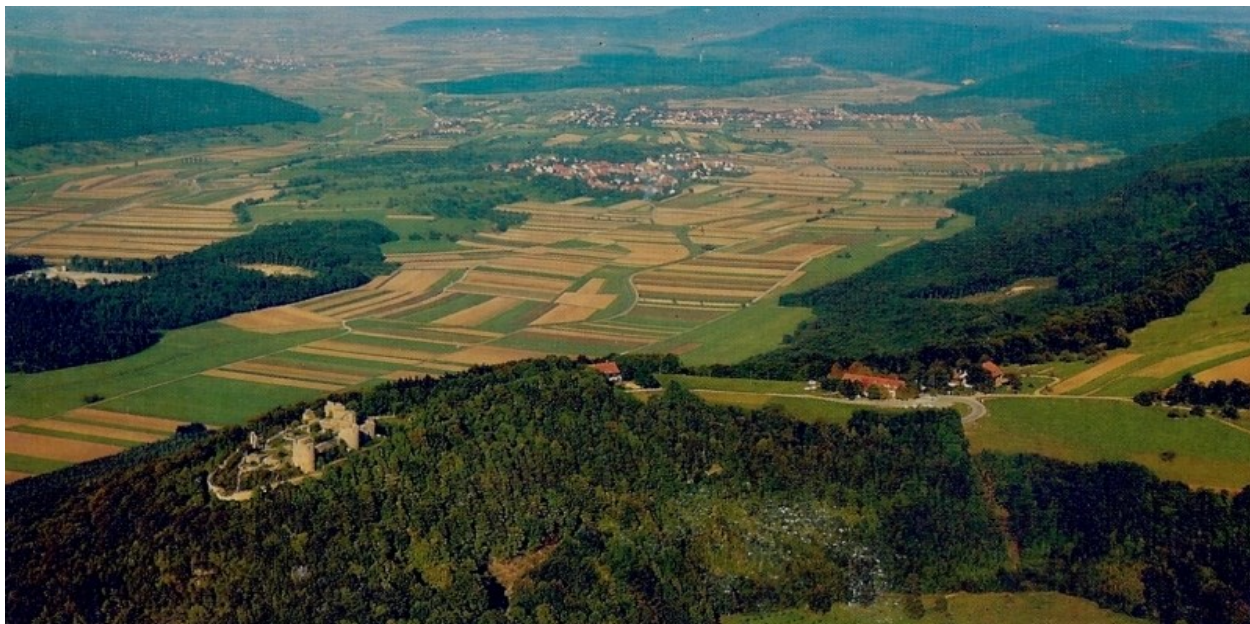
Die Küssaburg im Klettgau-Tal

Der Autor dieses Beitrages fügt hier seine eigene Version hinzu: